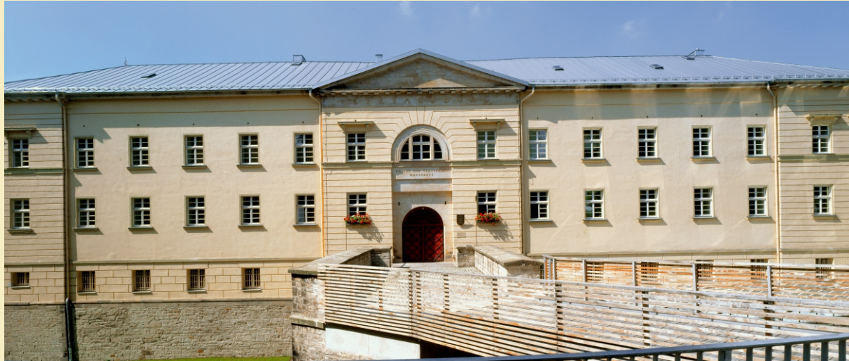
Das Deutsche Gartenbaumuseum in der denkmalgeschützten Cyriaksburg

Bitte an umseitige Adresse senden oder unter der Fax-Nr. 03 61 / 2 23 99 13